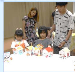
8/2 お菓子の空き箱で 家型ランプシェードを作ろう!