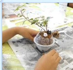
8/1 親子で作ろう! こけ玉ガーデン