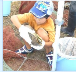
8/9 外来種アカミミガメをつかまえよう 淡水ガメ捕獲調査体験