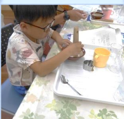
7/29 二酸化炭素ってどんなもの? 二酸化炭素を学び、入浴剤をつくろう!