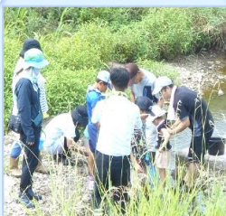
8/6 喜瀬川にはどんな 生き物がいるか観察しよう