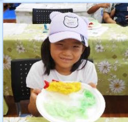
8/7 化学の力で 食品サンプルを作ろう!