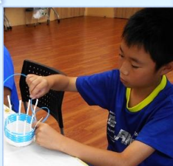
7/30 リサイクル紙バンドを使って 「くしらの小物入れ」を作ろう!