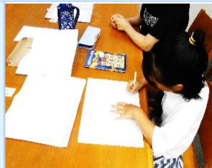
7/27 わくわく教室 (読書感想文を書こう!)