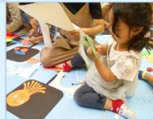
8/24 ブラックパネルシアター