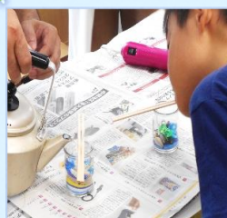
7/31 3Rとガラスびんの誕生を学び ガラスびんでキャンドルを作ってみよう