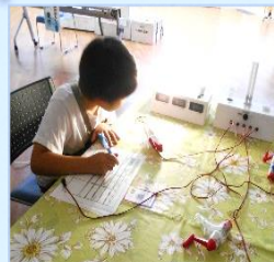
8/8 手回し発電機で電気を作ろう! ランプを使ってあかりのエコ体験をしよう